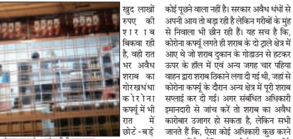
शोमार रस वृद्ध 10 बसे कुली वीर शराब दुकान

माही की गूंज, कलकत्ता-नदी। नरेन पंताल कोरोना महामारी में कोरोना कहर में चलते पूरा बाजार बंद है। छोटी-छोटी दुकान, पान की दुकान, चाय की दुकानों में अतिरिक्त छोटी-छोटी दुकानें फिरसे लगे गंजाने कमाये थे और