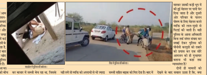
रिवा में पुलिस की बर्बात।

माही की गूंज, झुबुआ। कोरोना के इस संकट की चपटी में आम और क्या खास सब परेशान है। शासन-प्रशासन के सामने दिनभर कई समस्याएं रहती हैं, जिसके कारण प्रशासनिक नुमाइंदों का पार चला सा रहता है और उसके उलाहनाएं आए दिन हमें कई जगह देखने को मिल रही रहे हैं। इसी दौर में कई जगह प्रदेश की पुलिस का आम आदमी के साथ जो व्यवहार देखने को मिल रहा है, वह निन्दनीय भी है। हां केवल ये ही बात नहीं है कि, पुलिस हमें अपना आपा खोए दिखाई देती है, प्रदर्श में कई जगह पुलिस के सराहीय कार्य भी देखे जा सकते हैं। इंदौर का एक वीडियो वायरल हुआ था। जिसमें दो पुलिसकर्मी एक व्यक्ति को बीच-बीच परे मास्क न लगाने की बात पर पटक-पटक कर पीट रहे थे, मामले के तूल पकड़ने के बाद उन्हें समझे कर दिया गया था। जिसके बाद शहडोल के पीपल थामा क्षेत्र के अंतर्गत पुलिस का बर्बर प्रवृत्त एक व्यक्ति को पटक-पटक कर पीटने का वीडियो सामने आया था, जिसमें पुलिसकर्मी की दुर्भाव साहजिक हो रही है। वीडियो वायरल होने के बाद पुलिस का यह कलना है कि, वह व्यक्ति कोरोना कहर को उल्लेखन