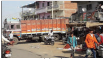
4 अंश को खली इलाक़ा शराब से मगदूम।