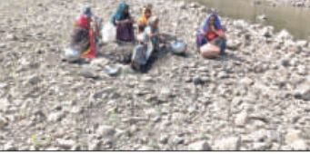
घाटा क्षेत्र में खड़ी नदी के हवाक से पानी इकट्ठे की कोशिश करते ग्रामीण ।

अप्रैल से पीएचडी विभाग द्वारा जिला प्रशासन को टैंकर चालू करने के आदेश के बाद पीने के पानी के टैंकर चालू हो जाते हैं। टैंकर की बात यह है कि, इस बार कोरोना संक्रमण की दूसरी लहर मुझे बाधे खड़ी हो गई है, वहीं सरकार ने इस दिन के सखन कोना कम्प्यू और एडवाइजरी का परामर्श जारी कर दिया है। जबकि महादारी और आम्बद में तत्काल एक्शन लेकर नान कमांड गांवों को जनता को अपने-अपने गांव और परिवारों में पानी को सुविधा मुहैया कराना चाहिए, जहाँ संक्रमण की चैन तोड़ी जा सके। लेकिन कुशलराव विधानसभा (166) की पंचायत समिति कुशलराव और सखनगांव में कुल 92 के करीब ग्राम पंचायतों को टैंकर पांच दर्जन से अधिक ग्राम पंचायतों के विभिन्न