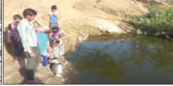
कुरुलगुड पंचायत समिति के द्वारा क्षेत्र में टैंकर शुरू नहीं होने से रात पानी पीने को मजबूर ग्रामीण ।